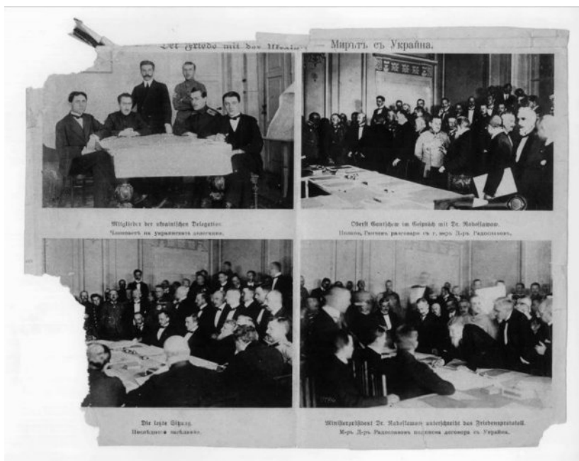
НБКМ - БИА, С V 602 Радославов подписва договора с Украйна 1918 г.