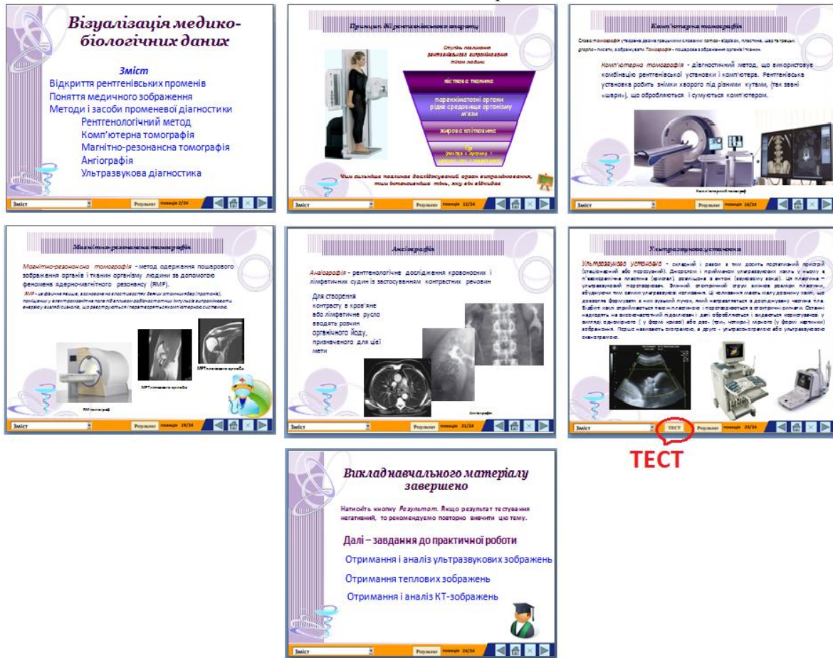
Рис. 1. Презентація «Візуалізація медико-біологічних даних», що входить до ЕП із медичної інформатики (деякі слайди містять гіперпосилання на тестову програму)

Із досвіду використання наведеної вище тестової програми «Конфігуратор» можемо констатувати, що вона досить зручна для викладача, однак має суттєві недоліки: