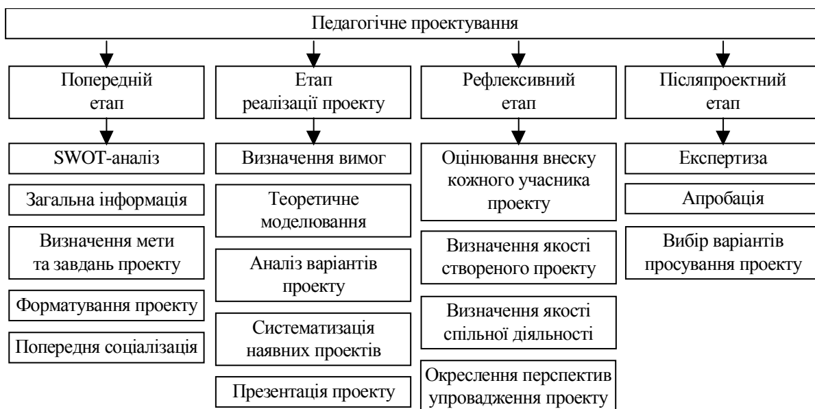
Рис. 1. Етапи методу проектування з теми «Перспективи та проблеми розвитку малих готелів»

На практичних заняттях із дисципліни «Організація готельного господарства» при вивченні теми «Перспективи та проблеми розвитку малих готелів в Україні» студенти, які навчалися за напрямом 6.140101 «Готельно-ресторанна справа» методом проектування розробляли проект «Малий готель». Практичне заняття передбачало реалізацію такої мети: обґрунтувати необхідність, перспективність і дієздатність малих готелів у м. Запоріжжя. У ході практичного заняття студенти мали обговорити такі питання: Як зробити бізнес-план малого готелю? Як спланувати формування послуг; ціноутворення? Як підібрати персонал малого готелю? тощо. Для досягнення навчальних цілей виділялося чотири етапи методу проектування з теми «Перспективи та проблеми розвитку малих готелів», які представлені на рис. 1.