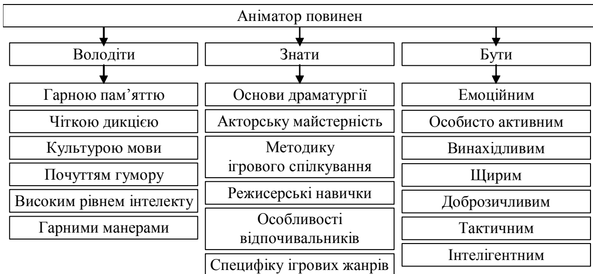
Рис. 2. Професійні вимоги до аніматора (розробка автора)

Крім того, на практичних заняттях нами застосовувався метод дискусій. Дискусія – ефективний метод групової взаємодії, який активно використовується серед студентів Інституту здоров'я, спорту і туризму Класичного приватного університету та сприяє організації спільної діяльності й інтенсифікації процесу прийняття рішень у групі за допомогою обговорення проблеми або певного запитання. Так, студентам 4-го курсу напряму 6.140101 «Готельно-ресторанна справа» на практичному занятті із дисципліни «Організація анімаційних послуг» (тема: «Кадрове забезпечення індустрії дозвілля») було запропоновано метод дискусії, у ході якої активно обговорювалися такі питання: склад анімаційної служби туристичного та готельного комплексу; головні завдання методиста-аніматора; професійні кваліфікаційні рівні аніматорів; характеристика персоналу готельних анімаційних служб; трудограма професії тураніматора; модель фахівця туранімації; характеристика персоналу готельних анімаційних служб. У підсумку були розроблені професійні вимоги до аніматора високого рівня, які наводяться на рис. 2.