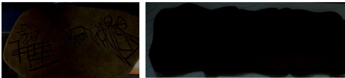
Рис. 3. Petroglyphs

Methods of determining the effects includes a table 1 that describes the relationship between the channels of human interaction with the environment, their targets and the qualitative characteristics of interactions (i.e., overall structure); numerical characteristics of channels (number, priorities); the formulas that determine the distribution of potential between the levels and channels, which allows to determine the range of changes of physiological parameters of the person, highlighting areas of comfort, fatigue, and pathology; the table of indicators of comfort, adapted to the conditions of the problem of estimation; estimation procedure; the processing algorithms and the presentation of the results; "the comfort formula" for determining the final evaluation of the environment[6].