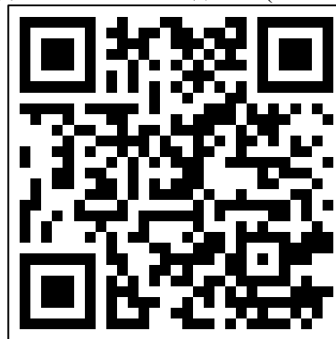
Рис. 2. Робота здобувачів вищої освіти групи 418-ф Іванченко Ганни та Безсонової Вероніки

сценарій роботи з паратекстом, який варто запропонувати учням: «Уявіть, що ви є дизайнером обкладинок у книжковому видавництві, чиї видання розраховані на елітарного вибагливого читача. Ваші потенційні покупці добре розуміються на всіх тонкощах середньовічної літератури, зокрема й на жанрових особливостях лицарського роману. Яку обкладинку ви запропонували б для роману «Трістан та Ізольда»? А чи змінився б ваш підхід до оформлення цієї книги, якби ви були зорієнтовані на сучасного масового читача? Як саме і чому? З огляду на розроблені вами варіанти обкладинок запропонуйте анотації до книги, розставивши відповідні смислові акценти». Такий підхід сприятиме формуванню в здобувачів освіти обізнаності у сфері культури, спонукатиме до самовираження. На ілюстрації представлено один із прикладів виконання завдання (Рис. 3).