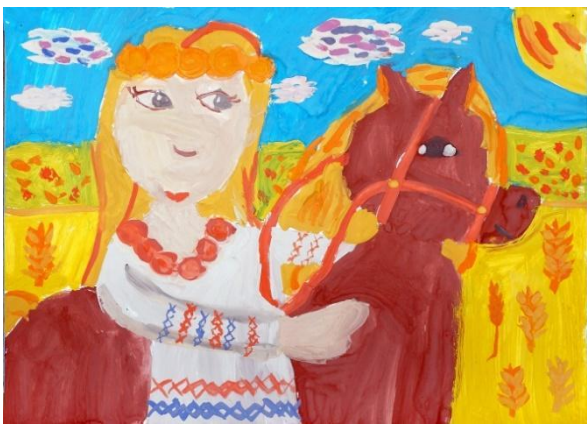
Рис. 3. Українка