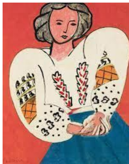
Рис. 2. Румунська блуза, 1940 р.