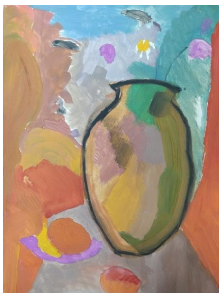
Рис. 7. Натюрморт