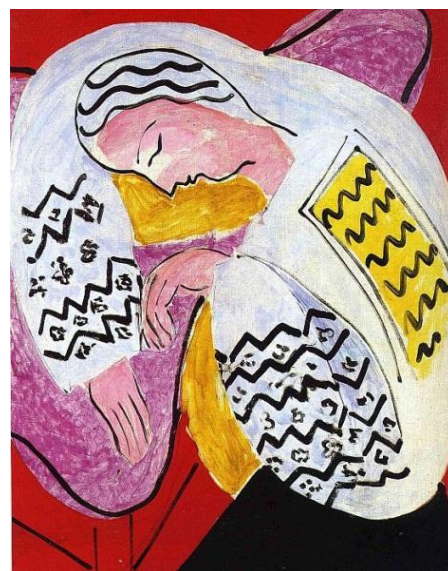
Рис. 1. Румунська блуза, 1940 р.

Роботи А. Матісса, яскравого представника цього стилю у мистецтві, тому підтвердження («Румунська блуза», 1940 р., «Натюрморт», 1943 р., «Яблука на столі на зеленому тлі», 1916 р. (рис. 1, 2, 5, 6). Анрі Матісс вживав чисті, звучні кольори, сильні та розгонисті мазки. Художник говорив про те, що важливо сприймати експресивний бік кольору інтуїтивно, створювати образи ірраціональною мовою, зосередивши свою увагу та внутрішню чуттєву потребу самовираження. Зображуючи, наприклад, пейзаж, необхідно пригадати кольори осені, її відтінки, що надихають на естетичне відчуття тієї чи іншої пори року. Обирати колір необхідно не раціонально, а за відчуттям та досвідом.