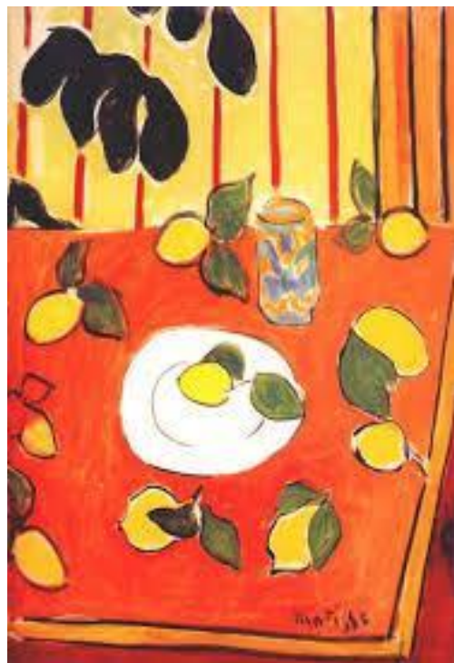
Рис. 5. Натюрморт, 1943 р.

Зауважимо, що відсутність лінійної перспективи, використання примітивних форм, одноплановість композиції або її вид згори – це ознаки, характерні живопису дитини старшого дошкільного віку. Яскраві чисті кольори (червоний, жовтий, синій) ще краще підкреслюють присутність природності та наївності на дитячих малюнках дітей старшого дошкільного віку. Загалом, при сприйнятті цих творів бачимо зведення форми до простих абрисів, в художніх образах чітко прослідковується природна, що характерна для дошкільного віку, «відмова» від світлотіні та лінійної перспективи, що підкреслює емоційну виразність дитячих творів.