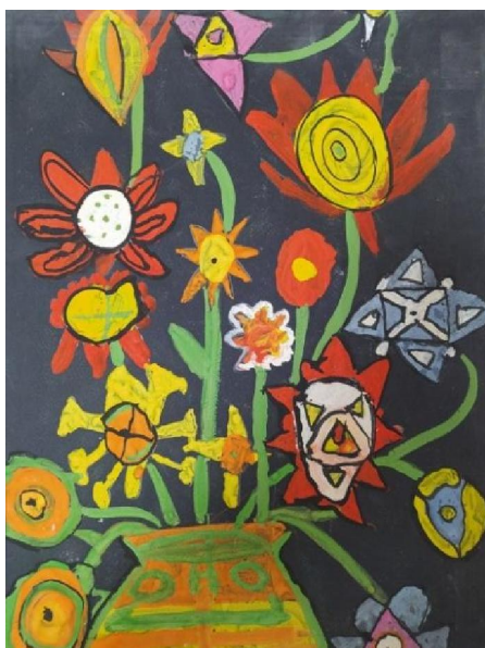
Рис. 8. Натюрморт

Отже, як і діти дошкільного віку, багато художників-фовістів писали картини густо нашаровуючи фарби на полотно, накладаючи їх таким чином, що створювалась своєрідна фактура. Особливої уваги заслуговує аналіз «улюблених кольорів та їх поєднання»: зелених і червоних, жовтих і фіолетових, червоних і синіх кольорів. Серед улюблених поєднань кольорів та відтінків – драматично-червоні, фіолетові, фіолетово-сині, темно-зелені, пурпурно-коричневі (такі кольори часто замінюють чорні тони). На роботах видно використання напружених, ніби недоречних контрастів. Це створюється завдяки посиленню колірної насиченості тіней і рефлексів (червоний предмет і на ньому яскраво-сині чи смарагдові тіні). І те, що активно кидається в очі під час сприймання робіт – активне використання кольорового контуру, що відокремлює одну форму від іншої, підкреслює їхню схематизацію і узагальнення, підсилює силуетність образу, ще більш виразнює деформовані елементи зображення, підсилює експресію, глибинність та індивідуальність створеного образу.