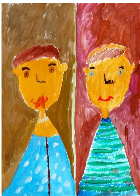
Рис. 11. Портрет родини