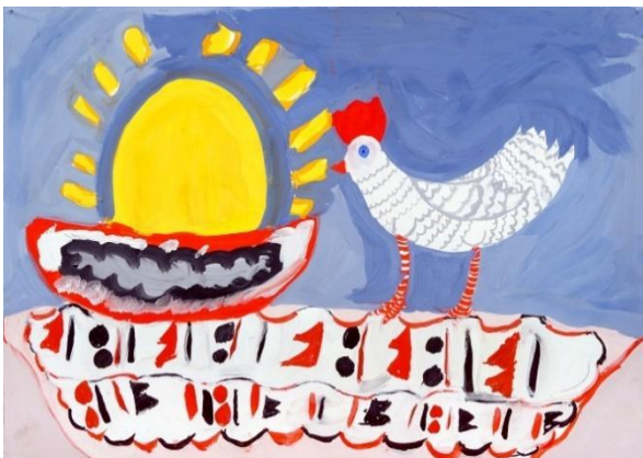
Рис. 4. Курочка Ряба (казка)

Характерними ознаками для художніх образів, створених дитиною, є використання елементів геометричного й рослинного орнаменту (прямі та хвилясті лінії, крапки, ромби, трикутники, гілочки та квіточки). Розглядаючи композиції, ми бачимо що максимально часто використовується червоний, жовтий, синій чи білий кольори. Внаслідок цього композиція сприймається надзвичайно насиченою інтенсифікацією палітри. Узагальненість форми та різкий, «невірний», з точки зору композиції,