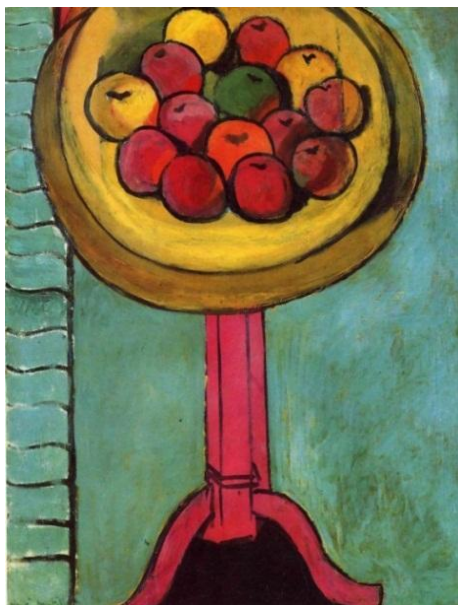
Рис. 6. Яблука на столі на зеленому тлі, 1916 р.