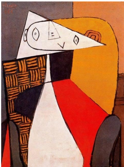
Рис. 9. Портрет жінки, 1935 р.