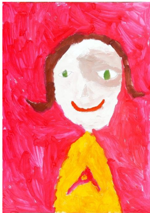
Рис. 12. Портрет мами