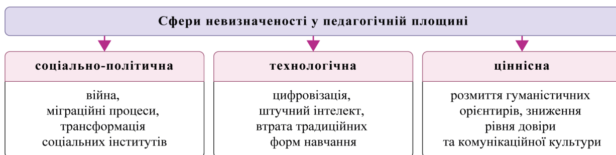
Рис. 5. Сфери невизначеності у педагогічній площині

Невизначеність у педагогічній площині має багатовимірний характер. Вона може бути: соціально-політична (війна, міграційні процеси, трансформація соціальних інститутів); технологічна (цифровізація, штучний інтелект, втрата традиційних форм навчання); ціннісна (розмиття гуманістичних орієнтирів, зниження рівня довіри та комунікаційної культури). Наочно розуміння сфери невизначеності у педагогічній площині відображено на рис. 5.