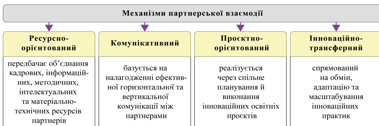
Рис. 3. Механізми партнерської взаємодії

Комунікативний механізм базується на налагодженні ефективної горизонтальної та вертикальної комунікації між партнерами. Його функції полягають в узгодженні інтересів і ціннісних орієнтирів; формуванні довіри та професійної солідарності; забезпеченні прозорості ухвалення рішень; підтриманні високої швидкості інформаційного обміну. Цей механізм дозволяє партнерам оперативно реагувати на зміни, знижуючи рівень невизначеності.