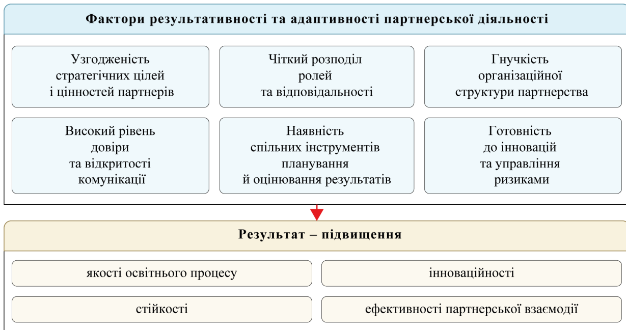
Рис. 4. Фактори результативності та адаптивності партнерської діяльності

Завдяки шести факторам, що зображені на рис. 4, партнерство перетворюється на адаптивну систему, здатну ефективно функціонувати в умовах швидких змін та невизначеності. Надамо деталізований науково обґрунтований опис кожного фактора.