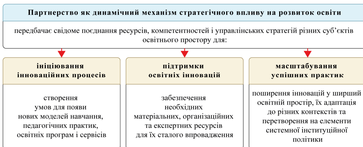
Рис. 2. Партнерство як динамічний механізм стратегічного впливу на розвиток освіти

інноваційних рішень; підвищення якості освітнього процесу через доступ до взаємодоповнювальних ресурсів.