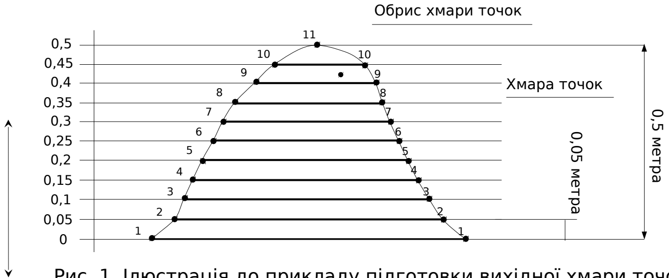
Рис. 1. Ілюстрація до прикладу підготовки вихідної хмари точок

У наведеному прикладі (рис. 1) маємо десять горизонталей та одинадцять точку, у яку виродилась горизонталь. Для того, щоб сформувати, на поверхні хмари точок, дискретно подані горизонталі, для рівнів 2, ..., 10, діємо наступним чином (рис. 2).