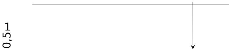
Рис. 2. Схема відхилень від рівнів горизонталей. Отримані таким чином точки, зобразимо на горизонтальній площині і виконаємо аналіз щодо побудови додаткових горизонталей (рис. 3).

Виходячи з отриманої щільності точок у вихідній хмарі та з наявного досвіду моделювання і дотримання необхідної точності реконструкції топографічної поверхні, обираємо допуск \epsilon на відхилення аплікату точок, що будуть визначати дискретну горизонталь, від аплікату відповідного рівня. На наш погляд, цей допуск \epsilon не повинен перевищувати 10% відстані між суміжними рівнями. У нашому прикладі, прийнято відстань 0,05h метра між рівнями 1 та 2 і 2 та 3, тому \epsilon \leq 0,05h сантиметрів. Відносно рівня горизонталі h_2 усім точкам, що мають аплікату Z_i у межах (h_2 - 0,5 \epsilon) \leq Z_i \leq (h_2 + 0,5 \epsilon) призначаємо аплікату горизонталі другого рівня Z_i = Z_2 . Аналогічно виконуємо і для інших рівнів 3, 4, ..., 10. Для першого рівня відхилення дорівнює h_1 + 0,5 \epsilon і усім точкам, аплікати яких Z_i \leq h_1 + 0,5 \epsilon , призначаємо Z_i = Z_1 . Для вершини 11 відхилення призначаємо h_{11} - 0,5 \epsilon і усім точкам, аплікати яких Z_i \leq h_{11} - 0,5 \epsilon , призначаємо Z_i = Z_{11} .